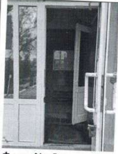
Фото № 6