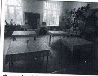
Фото № 11