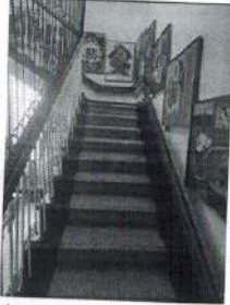
фото № 8