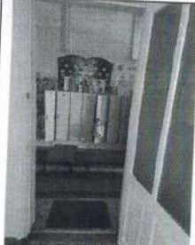
Фото № 9