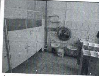
Фото № 13