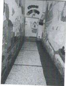
фото № 7