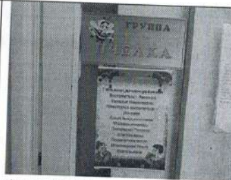
Фото № 14