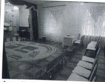
Фото № 12