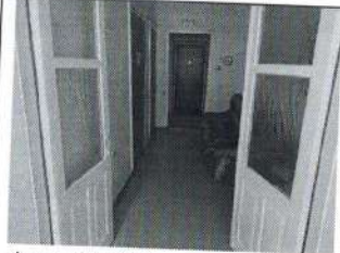
Фото № 10